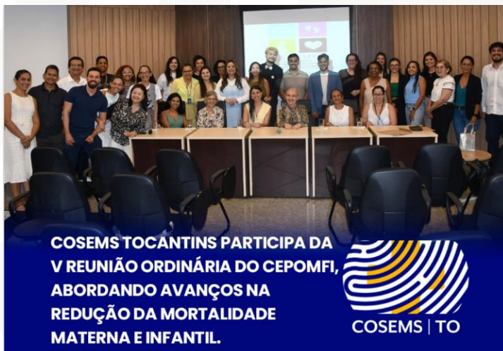
Figura 17 - V Reunião Ordinária do Comitê Estadual de Prevenção de Óbito Materno, Fetal e Infantil (CEPOMFI).

A V Reunião também proporcionou uma discussão profunda sobre os desafios e avanços no enfrentamento das causas da mortalidade materna e infantil. A implementação de políticas de qualidade de vida pós-parto e o fortalecimento da rede de apoio à saúde das mulheres também