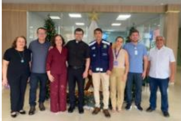
Figura 33 - mobilização nacional do Sistema Único de Saúde (SUS) para realização de cirurgias e exames eletivos.