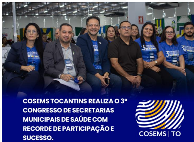
Figura 15 - Diretoria do 3º Congresso das Secretarias Municipais de Saúde do Tocantins

Além disso, é importante reconhecer a contribuição dos patrocinadores e das Secretarias de Saúde de Gurupi, que se destacaram no apoio e envolvimento com a programação do evento. COSEMS Tocantins também expressa seu agradecimento aos colaboradores e parceiros do evento, que contribuíram para que tudo acontecesse da melhor forma possível, garantindo a realização de um congresso de alta qualidade e impacto para a saúde pública no estado.