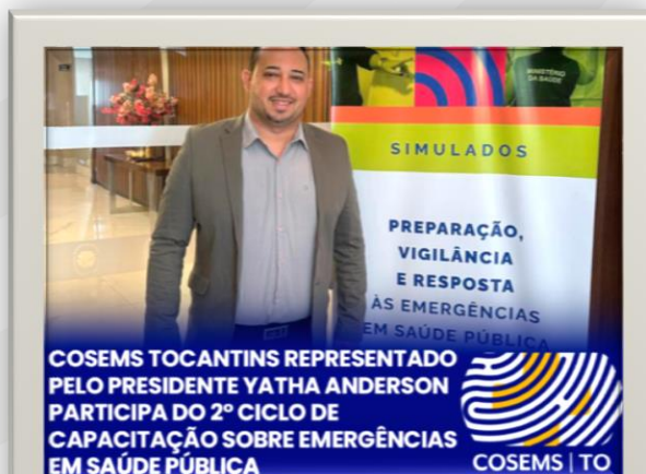
Figura 1 - 2º Ciclo da Oficina de Preparação, Vigilância e Resposta às Emergências em Saúde Pública Simulado (ESP-Simulado).

Dando início aos trabalhos no dia 02 de setembro, o Conselho de Secretarias Municipais de Saúde do Tocantins (COSEMS-TO) participa do 2º Ciclo da Oficina de Preparação, Vigilância e Resposta às Emergências em Saúde Pública Simulado (ESP-Simulado) , que está sendo realizado em Palmas. O evento, promovido em parceria com o Ministério da Saúde (MS) e a Secretaria de Estado da Saúde do Tocantins (SES-TO), reúne