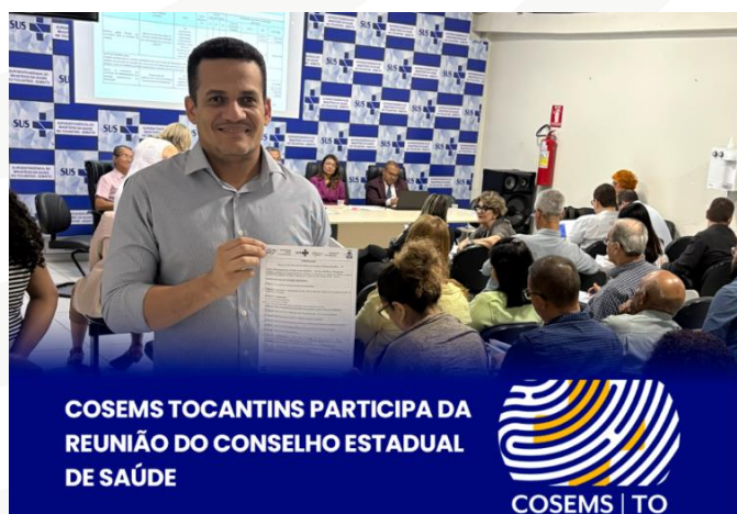
Figura 29 – Reunião do Conselho Estadual de Saúde.

A reunião teve como pauta a apresentação da Programação Anual de Saúde (PAS) 2026, que integra as diretrizes do Plano Estadual