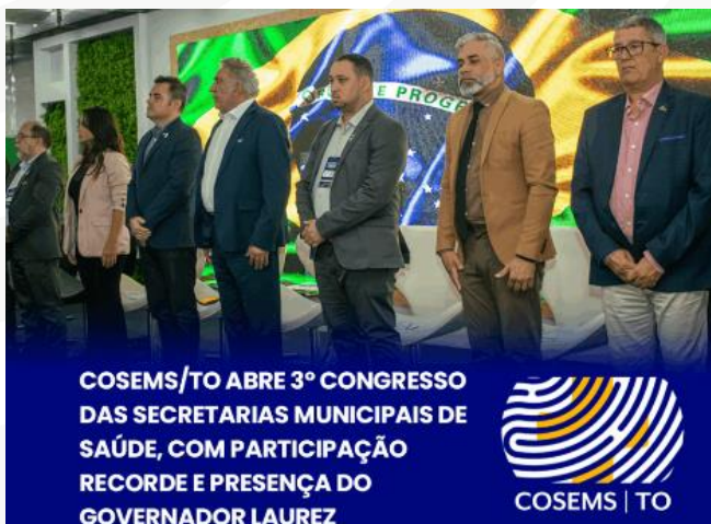
Figura 13 – Abertura do 3º Congresso das Secretarias Municipais de Saúde.

Tida como inédita, a participação do governador do Tocantins, Laurez Moreira, reforçou a saúde, com o