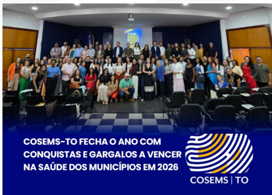
Figura 32 - Reunião ordinária do Conselho de Secretarias Municipais de Saúde do Estado do Tocantins do ano de 2025