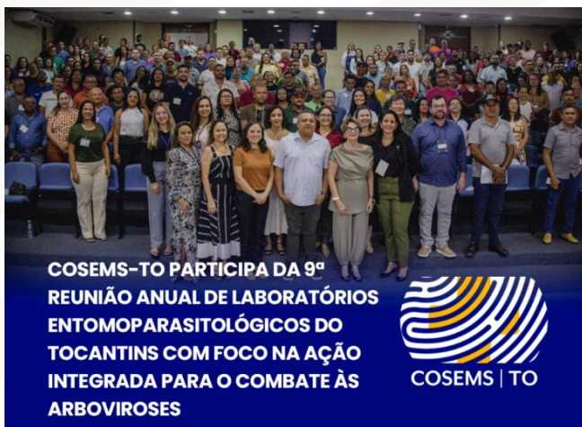
Figura 27 - 9ª Reunião Anual de Laboratórios Entomoparasitológicos do Tocantins