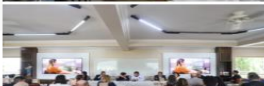
Figura 28 - Reunião do Conselho Nacional de Representantes Estaduais (Conares).