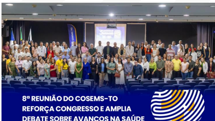
Figura 12 - 8ª reunião ordinária do Conselho de Secretarias Municipais de Saúde do Tocantins (COSEMS/TO).

100 mulheres já foram beneficiadas com procedimentos como ultrassonografias e a inserção, assim como o Dispositivo Intrauterino (DIU), e o Implanon. FOTOS OFICIAIS: https://cosemsto.org/eventos .