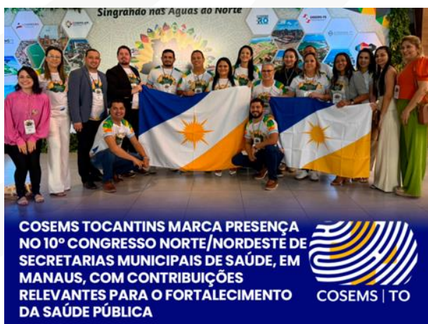
Figura 3 – 10º Congresso Norte/Nordeste de Secretarias Municipais de Saúde

A caravana do Conselho de Secretarias Municipais de Saúde do Estado do Tocantins participou nos dias 06 a 08 de setembro de 2025, do 10º Congresso Norte/Nordeste de Secretarias Municipais de Saúde, realizado em Manaus , se consolidou como um evento de grande importância para o aprimoramento das políticas públicas de saúde nas regiões Norte e Nordeste do Brasil. Com a participação de gestores e profissionais de saúde de todos os 16 estados dessas regiões, o evento foi uma plataforma de troca de experiências e discussões sobre os desafios e avanços no Sistema Único de Saúde (SUS). Este congresso, que reuniu mais de 2.244 municípios, foi um marco para fortalecer a cooperação e o desenvolvimento de soluções que respondem às necessidades mais urgentes da saúde pública no Brasil.