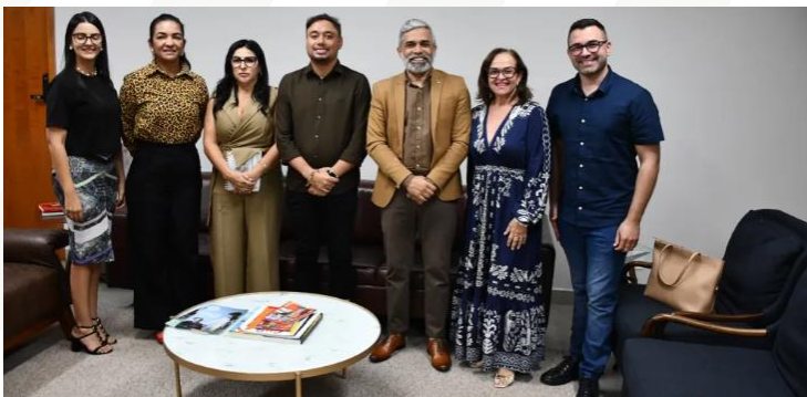
Figura 26 – Reunião, os secretários municipais enfatizaram a necessidade de adequar os recursos financeiros

Na oportunidade, os secretários de saúde de Tocantinópolis e Araguatins pediram orientação ao Secretário de Estado da Saúde sobre como iniciar essa caminhada de equiparação de recursos e de