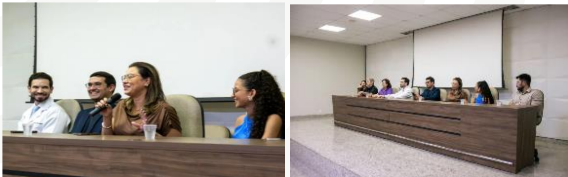
Figura 16 – Abertura do XX Seminário do Internato Rural .

Com uma carga de 16 semanas no Internato Rural, o seminário é um dos momentos culminantes do curso. Embora o internato tenha uma duração total de 16 semanas, os alunos passam efetivamente 14 semanas nos municípios, já que uma semana é dedicada ao deslocamento e a última é reservada para avaliação e a realização do