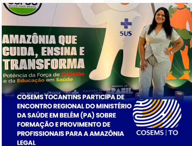
Figura 20 – evento “Amazônia que Cuida, Ensina e Transforma: Potência da Força de Trabalho e da Educação em Saúde”, realizado nesta sexta-feira (31), em Belém (PA).

objetivo fortalecer estratégias de formação, provimento e Valorização dos profissionais de saúde na região, além de promover o diálogo interfederativo e a troca de experiências entre os entes federativos.