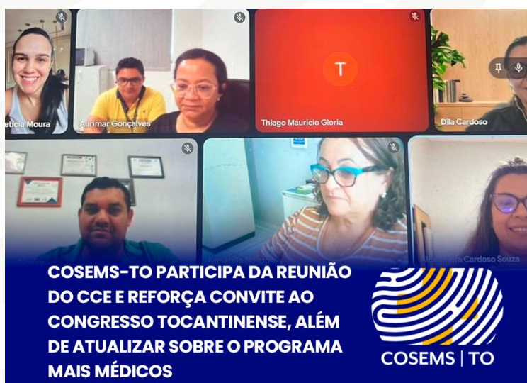
Figura 8 - Reunião online da Comissão de Coordenação Estadual do Programa Mais Médicos (CCE-TO).

melhoria da atenção especializada no país, tem contribuído significativamente para a redução das desigualdades no atendimento à saúde. O edital de chamamento público nº 3/2025, publicado em julho deste ano, prevê a seleção de 1.778 médicos especialistas para atuarem em diversas