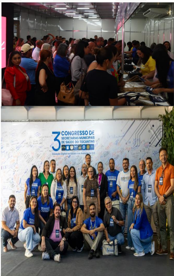
Figura 36 – 3º Congresso Tocantinense de Secretarias Municipais de Saúde

Entre os principais desafios identificados, destacaram-se as dúvidas recorrentes dos gestores quanto à aplicação de emendas parlamentares e a necessidade de aprofundamento das discussões sobre ressarcimento interfederativo de medicamentos, pauta que demandou encaminhamento para momentos específicos de orientação técnica.