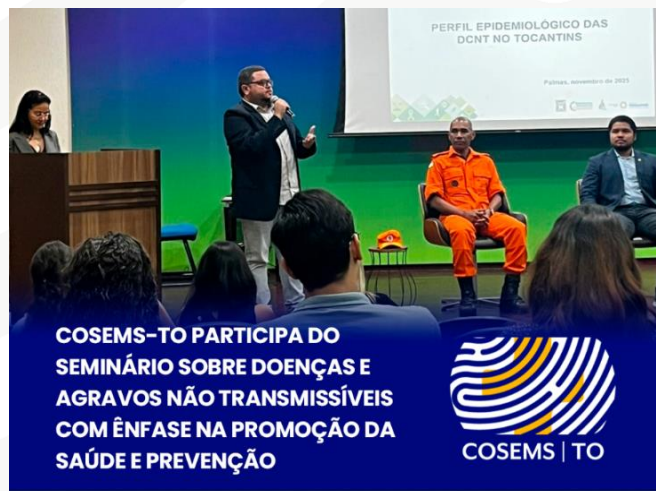
Figura 24 – Seminário de Doenças e Agravos Não Transmissíveis (DANTs).

destacando a importância do evento para os gestores municipais e profissionais da saúde. “Em nome do COSEMS, é com grande alegria que estamos aqui para discutir e refletir sobre as Doenças e Agravos Não Transmissíveis. Agradeço a presença de todos e parabeno a