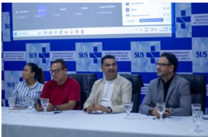
Figura 22 – 9ª Reunião Ordinária e discute avanços na saúde pública e atualização do estatuto. O Conselho de Secretarias Municipais de Saúde do Tocantins (COSEMS-TO)

O COSEMS-TO realiza a 9ª Reunião Ordinária e discute avanços na saúde pública e atualização do estatuto . O Conselho de Secretarias Municipais de Saúde do Tocantins (COSEMS-TO) realizou, nesta terça-feira (11), a 9ª Reunião Ordinária no auditório da Superintendência Estadual do Ministério da Saúde, em Palmas. O encontro reuniu secretários municipais de saúde, representantes da Secretaria Estadual