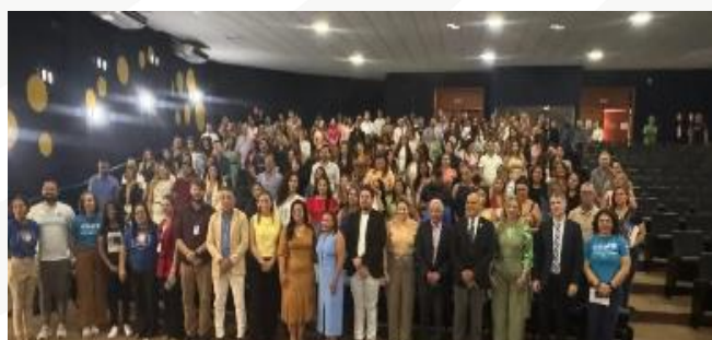
Figura 9 - 1º CICLO DE FORMAÇÃO DO SELO UNICEF PARA MUNICÍPIOS DO TOCANTINS

O Conselho de Secretários Municipais de Saúde de Tocantins (COSEMS-TO) esteve fortemente representado no TREINAMENTO PARA TESTAGEM DE G6PD E O ALGORITMO DE TRATAMENTO DA MALÁRIA , realizado nos dias 17 e