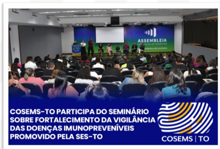
Figura 2 - Seminário sobre Fortalecimento da Vigilância das doenças imunopreveníveis promovido pela SES-TO.

Evento realizado pela SES-TO capacita profissionais da saúde sobre imunização e prevenção de doenças evitáveis por vacina